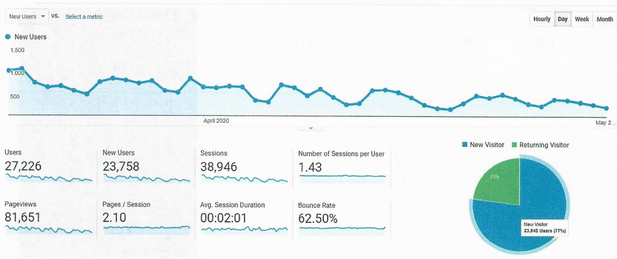
Слика 3. Број нових посетилаца интернет презентације ГО Звездара од проглашења ванредног стања до 2. маја 2020. године

На електронску адресу info@zvezdara.org.rs добијено је 252 питања грађана која су у највећој мери била везана за информације у вези са ванредним стањем. Грађани су најчешће постављали питања у вези са поделом пакета помоћи за пензионере са месечним примањима мањим од 30.000,00 динара, о добијању дозвола за кретање у периоду забране кретања, као и она која су била везана за рад одељења и служби Управе ГО Звездара. На питања је одмах одговарано или су прослеђивана надлежним организационим јединицама на обраду.